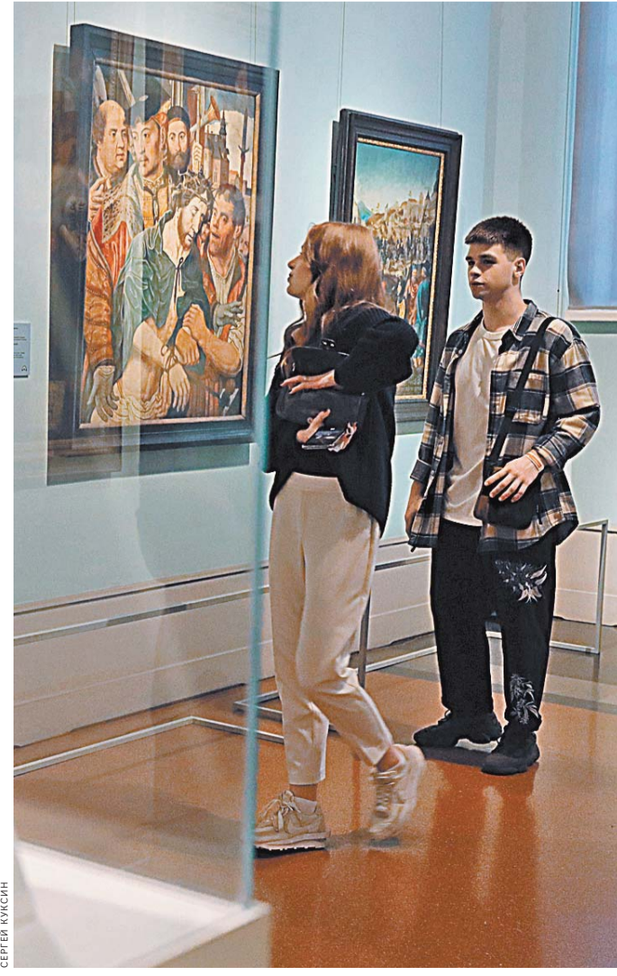
Вам от 14 до 22 лет? Отлично. «Пушкинская карта» на 3000 рублей — ваша.

— Но успех карты во многом зависит от того, насколько технологично и удобно будет орга-